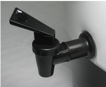
Abb. 6.7: Auslaufhahn eines Glühweinkessels

Beim Einkochkessel ohne Hahn müsste man das Wachs aus dem Kessel schöpfen. Glühweinkessel besitzen einen Hahn (Abb. 6.7). Dieser ist aber für Wachs nicht brauchbar. Erkalte flüssiges Wachs in einem solchen Hahn, so kann man den Wachspfropf nicht mehr entfernen.