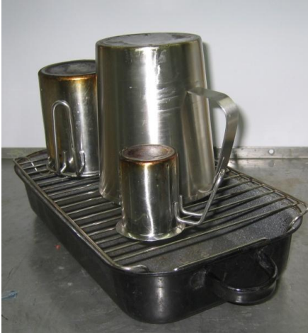
Abb. 6.3: Zum Abschmelzen von Wachsresten aus den Kannen - Konstruktion für den Backofen