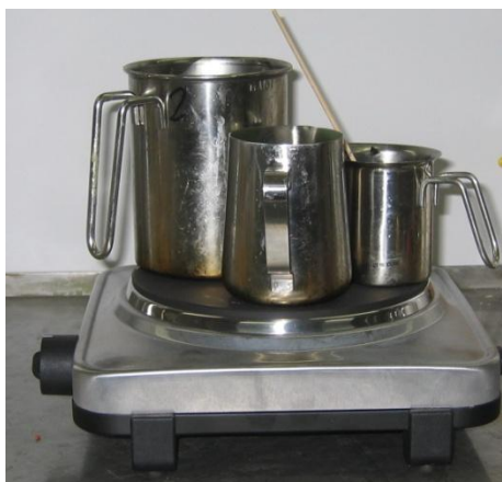
Abb. 6.6: Aufschmelzen in mehreren Kannen auf einer Herdplatte