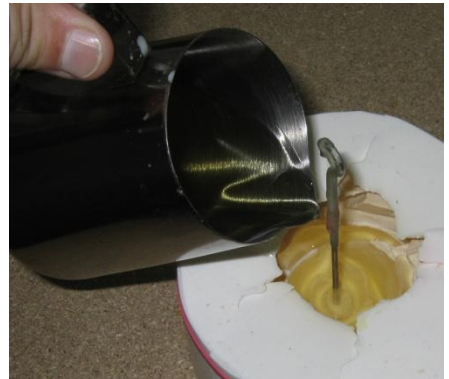
Abb.6:1: verschieden Ausführungen in Edelstahl und Emaille (links), Eingießen von Wachs in Kerzenform (rechts)